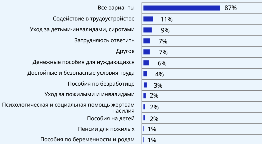
► Рисунок 2. Что представляет собой социальная защита? Процентная доля каждой категории в общем количестве ответов 5

В 2021 году в Узбекистане действовало в общей сложности 48 схем социальной защиты. Расходы на социальную защиту в процентном отношении к ВВП в последние годы снижались, и в 2020 году на эти цели было инвестировано около 7% ВВП (без учета здравоохранения). Наибольшая часть выделяемых на социальную защиту бюджетных средств – 85,6% – была направлена на программы социального страхования, 7,5% – на программы социальной помощи, 5,4% – на услуги социального ухода и 1,5% – на программы развития рынка труда. Несмотря на незначительный рост числа получателей услуг в сфере социальной защиты, ее охват также сократился. В ответ на кризис, вызванный пандемией COVID-19, в государственном бюджете на 2020 год было предусмотрено дополнительное финансирование здравоохранения и социальной помощи, а также увеличение государственных инвестиций. Так, количество домохозяйств, получающих социальную помощь, почти удвоилось. Тем не менее государственные расходы на всю систему социальной защиты в целом – на пенсионное обеспечение, социальное вспомоществование, услуги социального ухода и программы развития рынка труда – остаются относительно скромными.