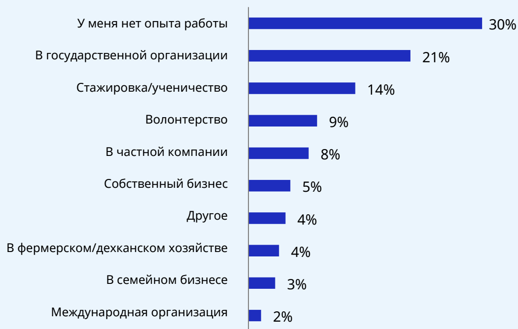
▶ Рисунок 5. Предшествующий или нынешний трудовой опыт респондентов

Трудовой опыт. Поскольку основной целевой группой платформы U-Report является учащаяся молодежь, 30% респондентов ответили, что опыта работы у них нет. Среди учащихся всех учебных заведений доля не имеющих опыта работы составила 37,8%. Среди безработных и тех, кто относится к категории неучащихся и неработающих, не имели опыта работы только 27%.