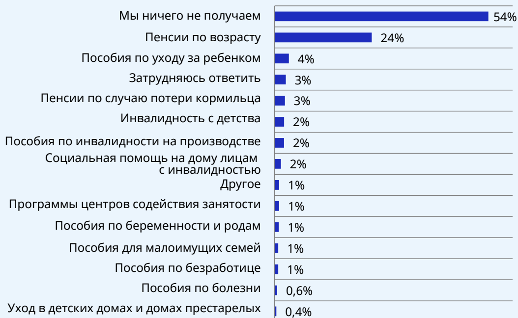
► Рисунок 3. Охват социальной защитой

Хотя бы одной программой социальной защиты охвачено только 55% населения Узбекистана (ILO, UNICEF and World Bank, 2020). Как показал проведенный опрос, 54% респондентов живут в семьях, где социальной защитой не охвачен никто из членов. Эти результаты соответствуют данным, полученным в ходе других масштабных обследований всех слоев населения.